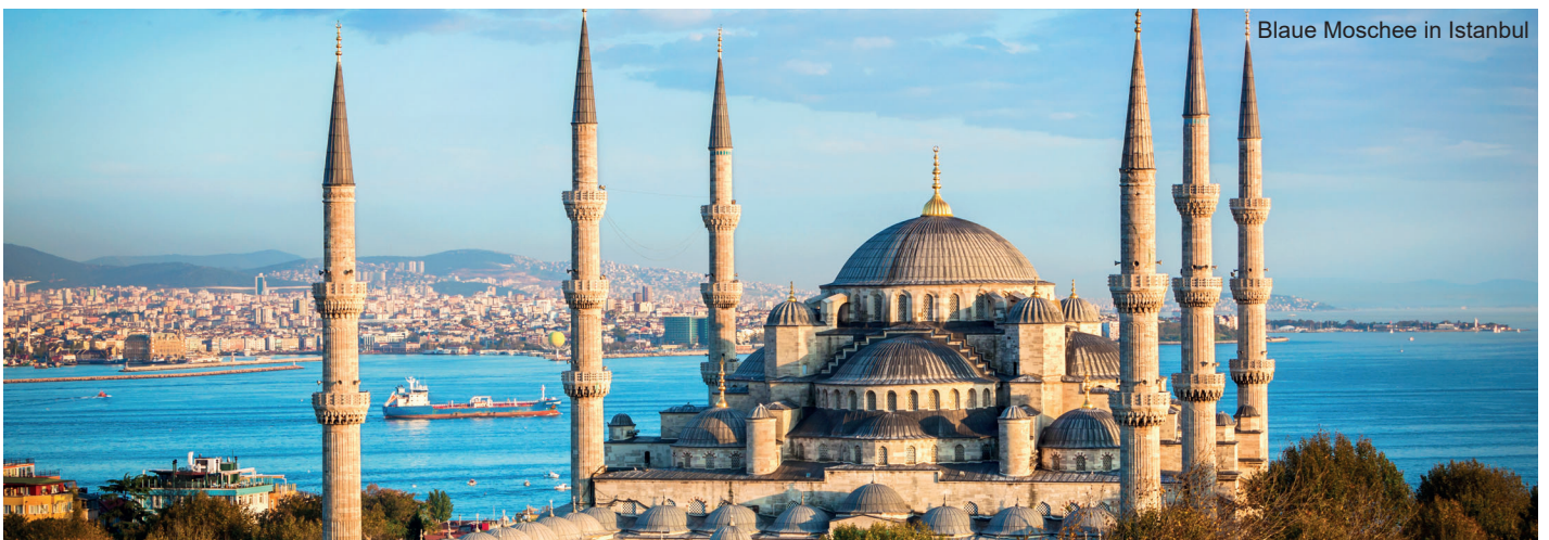
Blaue Moschee in Istanbul

Die Türkei – einst das Herz Kleinasiens – verbindet die Kulturen des Ostens und des Westens. Ihre Geschichte reicht von antiken Hochkulturen über das byzantinische Reich bis zum osmanischen Erbe. Auf dieser Reise tauchen Sie ein in die beeindruckende Vielfalt historischer Orte und erleben ein Land voller Kontraste und kultureller Tiefe.