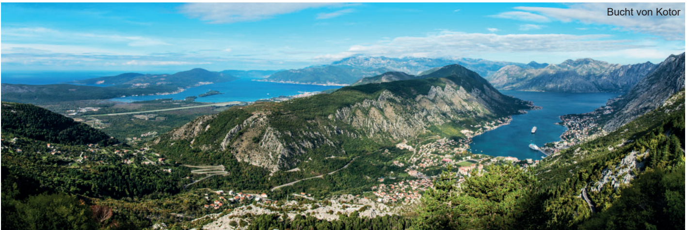
Bucht von Kotor

Viele schwärmen vom wunderbaren Montenegro. Grund genug, dieses wunderbare Land von noch unentdeckten Seiten auf wunderschönen Wanderungen zu erkunden. So beginnt unsere Reise in den Bergen im Norden Montenegros. Lassen wir uns von schwarzen Bergen, glitzernden Bergseen, tiefen Schluchten, wunderschönen Küstenlandschaften, historisch bedeutsamen Städten sowie wilden und unberührten Naturlandschaften verzaubern! Nicht umsonst wirbt Montenegro mit dem Slogan: „Wild Beauty!“