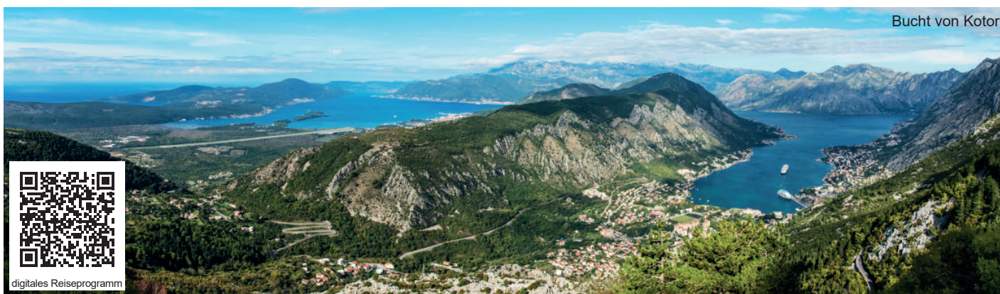
Bucht von Kotor

Viele schwärmen vom wunderbaren Montenegro. Grund genug, dieses wunderbare Land von noch unentdeckten Seiten auf wunderschönen Wanderungen zu erkunden. So beginnt unsere Reise in den Bergen im Norden Montenegros. Lassen wir uns von schwarzen Bergen, glitzernden Bergseen, tiefen Schluchten, wunderschönen Küstenlandschaften, historisch bedeutsamen Städten sowie wilden und unberührten Naturlandschaften verzaubern! Nicht umsonst wirbt Montenegro mit dem Slogan: „Wild Beauty!“