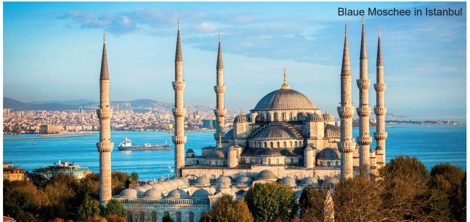
Blau Moschee in Istanbul

Nach dem Frühstück und Check-out Besuch der kleinen Hagia Sophia (Ayasofya Camii), die im 6. Jh. als Kirche der Heiligen Sergius und Bacchus