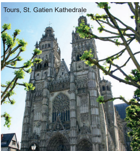
Tours, St. Gatien Kathedrale

Ausflug in das Gebiet der ehemaligen Provinz Poitou nach Poitiers, wo der hl. Hilarius als Bischof wirkte und den noch nicht getauften Martin im christlichen Glauben unterrichtete. Besuch der Basilika des hl. Hilarius, wo Hilarius, Martins Vorbild und Lehrer, begraben liegt. Nach der Feier einer heiligen Messe Mittagspause. Am Nachmittag Besichtigungsrundgang in der Altstadt von Poitiers mit dem Grande Salle des ehemaligen herzoglichen Palastes, der